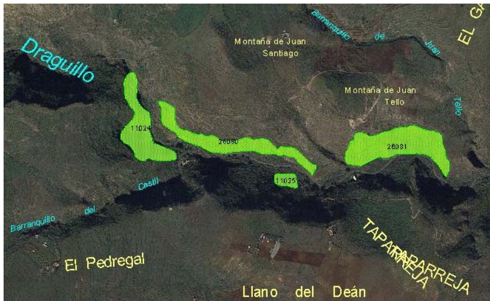
Fuente: Mapa de Unidades Arqueológicas de Gran Canaria.

Se aprecia la existencia de cartuchos de cazadores en algunos puntos del espacio, especialmente en aquellos lugares más altos. Asimismo, se ha encontrado una gran cueva, ubicada en una zona de reconocido interés arqueológico dentro de la cual se localiza un gran número de perros de caza atados y agrupados.